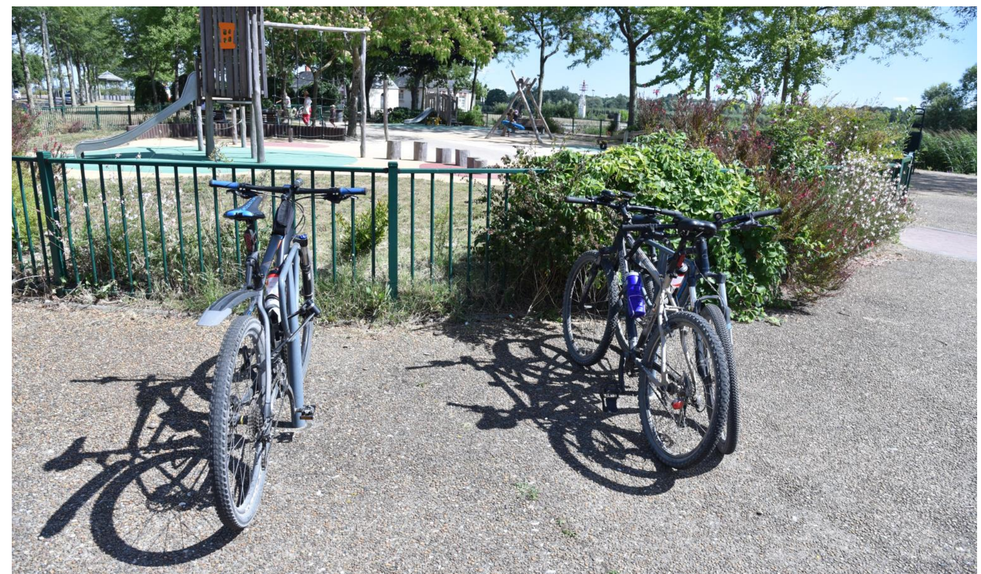
Appuis vélos - aire de jeux des bords de Loire

Nantes Métropole travaille actuellement à l'amélioration de sa stratégie de déploiement des appuis vélos sur l'espace public afin de garantir leur installation au plus près des besoins.