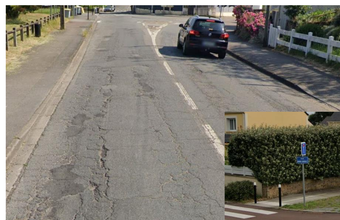
Rue Alexandre Oliver

L'état des routes, parfois dégradé, renforce également la dangerosité de la pratique cyclable.